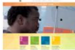
Portal Zgledi vlečejo