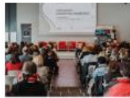
Letni posvet o izobraževanju odraslih