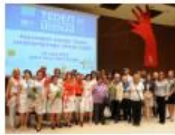
Priznanja za promocijo učenja in znanja odraslih