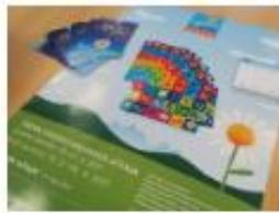
Teden vseživljenjskega učenja