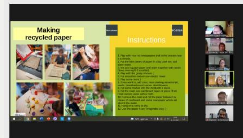
Utrinki z usposabljanja, ki je potekalo takole, na daljavo.