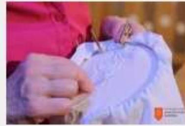
Vezenje po narisku