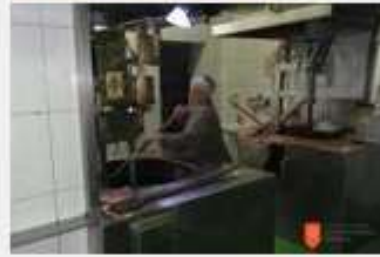
Pridelava bučnega olja