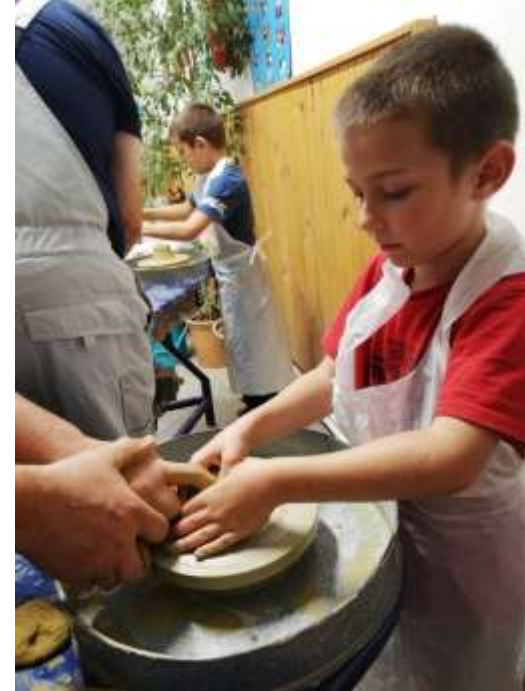
DEKD in TKD 2022: Števanovci, Porabje: Lončarska delavnica