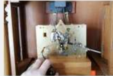
Popravilo mehanskih ur