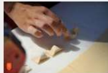
Priprava idrijskih žlikrofov